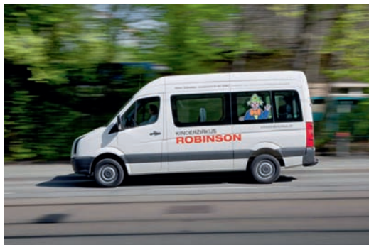
Der neue Transportbus des Kinderzirkus Robinson: ein Jubiläumsgeschenk der GGKZ.

Der Kinderzirkus Robinson, der 2010 sein 50-jähriges Bestehen feiern konnte, ist eines der ältesten und erfolgreichsten soziokulturellen Projekte im Kanton Zürich. Seit einem halben Jahrhundert bietet er Kindern von 4 ½ bis 15 Jahren eine sinnvolle, kreative Freizeitbetätigung, die nicht nur ihre körperlichen Fähigkeiten entwickelt, sondern auch ihre Persönlichkeit und ihre Sozialkompetenz stärkt. Das Angebot umfasst zum einen die Zirkusschule mit wöchentlichen Kursen, Workshops und Ferienkursen, in denen Kinder unter kompetenter Anleitung verschiedene Zirkusdisziplinen erlernen und trainieren können. Zum anderen haben besonders interessierte Artistinnen und Artisten im Alter von 6 bis 16 Jahren die Möglichkeit, ins Robinson-Ensemble einzutreten. In intensiven, von Profis geführten Trainings entwickelt und erarbeitet das Ensemble gemeinsam mit der künstlerischen Leitung ein Programm,