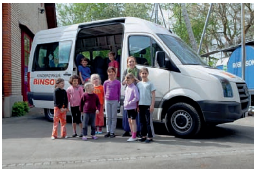
Der neue Bus bringt die kleinen Robinson-Artistinnen und -Artisten sicher zum Auftrittsort.